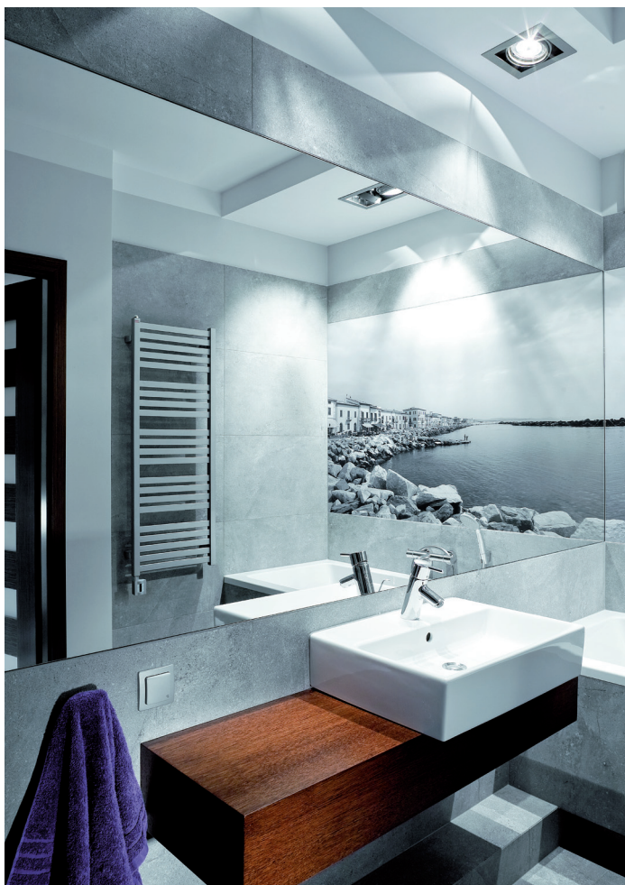
Der elegante Elektro-Heizkörper „Manta“ ist verchromt sowie in allen RAL-Farben erhältlich. Selbst Sonderfarben wie Silber, Gold, Antik oder Kupfer werden angeboten. 009 02