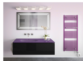
Modell Tomi besitzt leicht geschwungene Heizleisten und ist mit eleganten Handtuchhaltern ausgestattet. 004 02