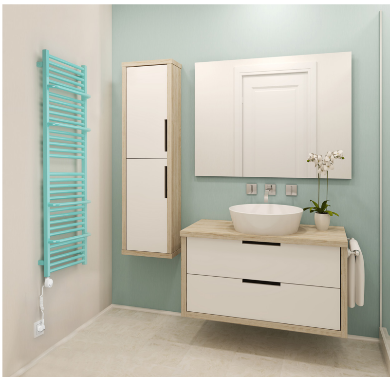
Bei Bedarf einfach einstöpseln, und schon wird es herrlich warm: Elektrobadheizkörper Lima bringt Farbe und Gemütlichkeit in jedes Badezimmer. 004 01

! Diese Textversion sowie zwei weitere Versionen können Sie im Internet herunterladen.